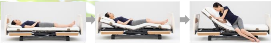
背と膝を同時にあげ