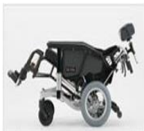
最大テイルト(30°)&最大リクライニング(30°)時